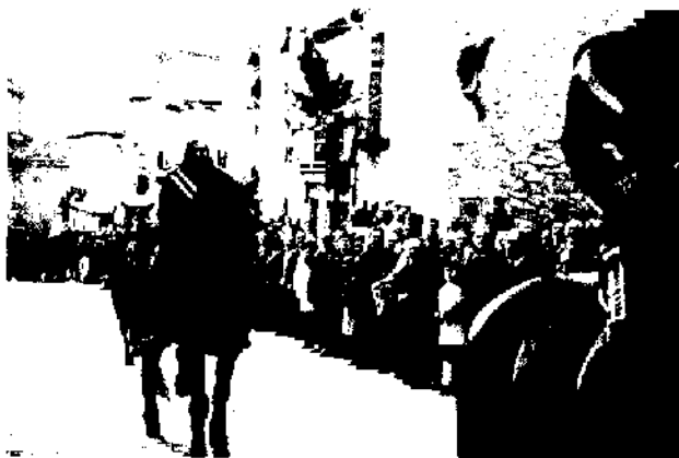
Fiesta de los Jefes. Silos.

“Al día siguiente, amarrada una soga de balcón a balcón en una de las bocacalles de la plaza, colgaban de ella unos gallos o gallinas vivas, cuya cresta tenía que arrancar cada jefe desde su caballo y pasearla después triunfalmente por el pueblo, clavada en la punta de la espada, mientras el tambor redoblaba incansablemente un ritmo tribal bien acompasado” (32).