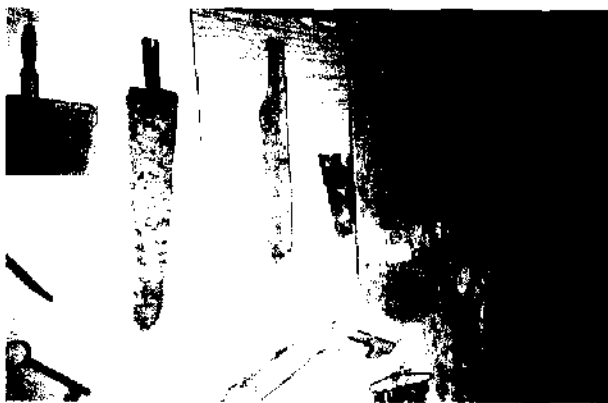
Instrumentos para confeccionar lenzuolos. Hortezuolos.

Las Navidades fueron igualmente fechas señaladas dentro del calendario festivo de la comar-