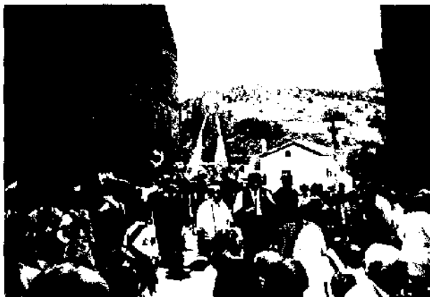
Virgen del Mercado. Silos

sarias y provistos de una estructura de maderas, se da forma al arco. Mientras esta labor es realizada bajo la atenta mirada de algunos adultos, se procede a realizar una cuestación entre los presentes. El dinero es destinado a los gastos que conlleva el ramo (dulces y guindas), pero también para sufragar las bebidas que se consumen en el momento. Cuando el ramo está consolidado, se procede a su adorno a base de flores (rosas especialmente) y rosquillas. Con galletas se escriben en grandes trazos las iniciales V. y M. El ramo, de considerable peso, es transportado desde la plaza hasta la puerta de la iglesia. Allí, con la ayuda de una escalera, los jóvenes más hábiles se encargan de situarlo en las guías que para tal cometido tiene la puerta de la iglesia.