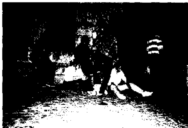
Preparando el ramo. Silos.

Colocar el ramo es ritual encomendado a los jóvenes del pueblo. El acto tiene lugar durante la madrugada del día 2. Pasada la medianoche, los jóvenes se reúnen en la plaza y comienzan la laboriosa construcción del arco vegetal que habrá de adornar la puerta de la iglesia durante el día de la Patrona. Cortadas las ramas de chopo nece-