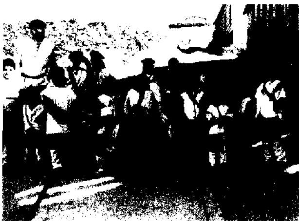
Fiesta de los Jefes. Siles.

La Misa Mayor. El Domingo, por la mañana, los tres Jefes, aviados con el mismo ceremonial que la víspera, llegan a la casa del Concejo, donde los está esperando el Ayuntamiento. Todos bajan a la puerta de la iglesia abacial de San Sebastián, en busca del cele-