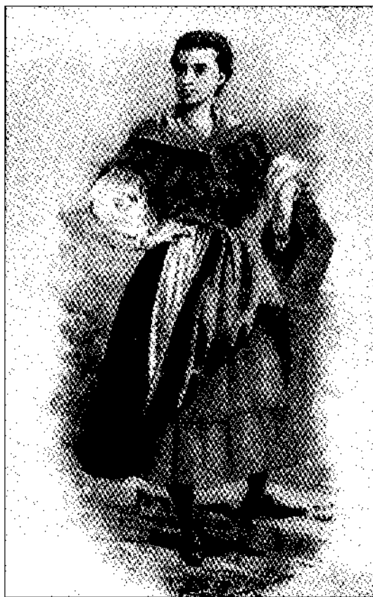
Mujer de Huesca